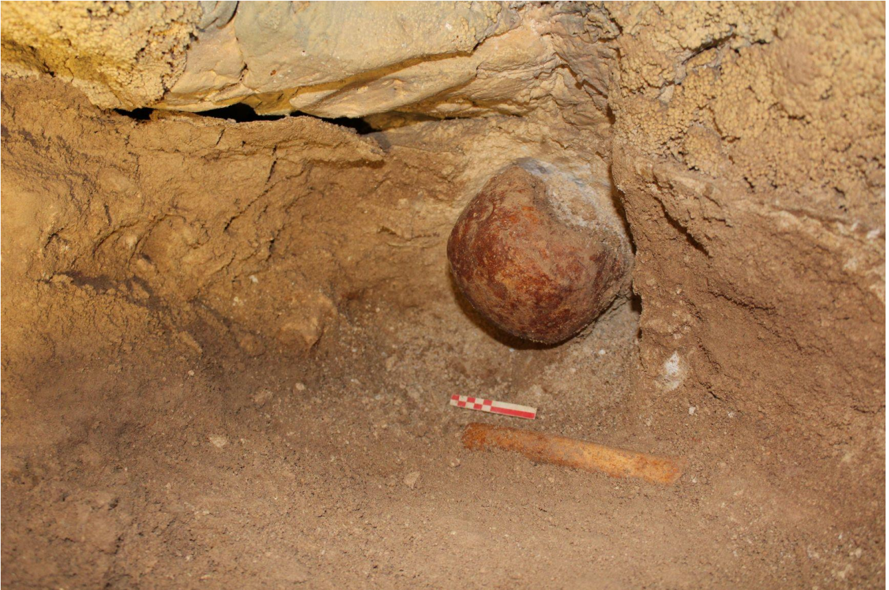
Figura 5- Sala del Laghetto. Cranio di Neanderthal rinvenuto durante lo scavo della paleosuperficie