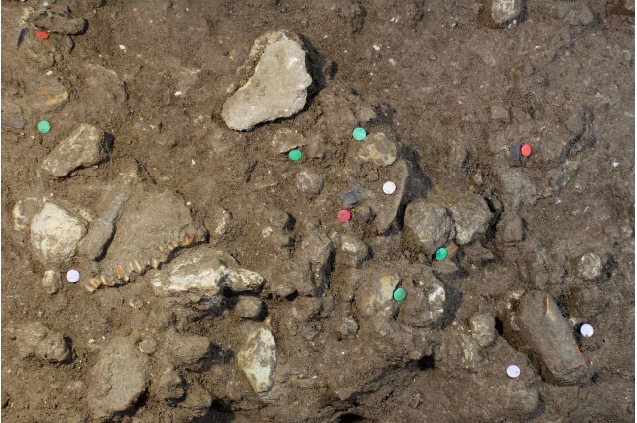
Figura 6- Porzione della paleosuperficie esterna la grotta. Con le puntine verdi sono indicati frammenti di industria litica, le puntine rosse segnalano frammenti faunistici carbonizzati e in bianco frammenti faunistici nonché probabili resti di pasto dell'uomo di Neanderthal.