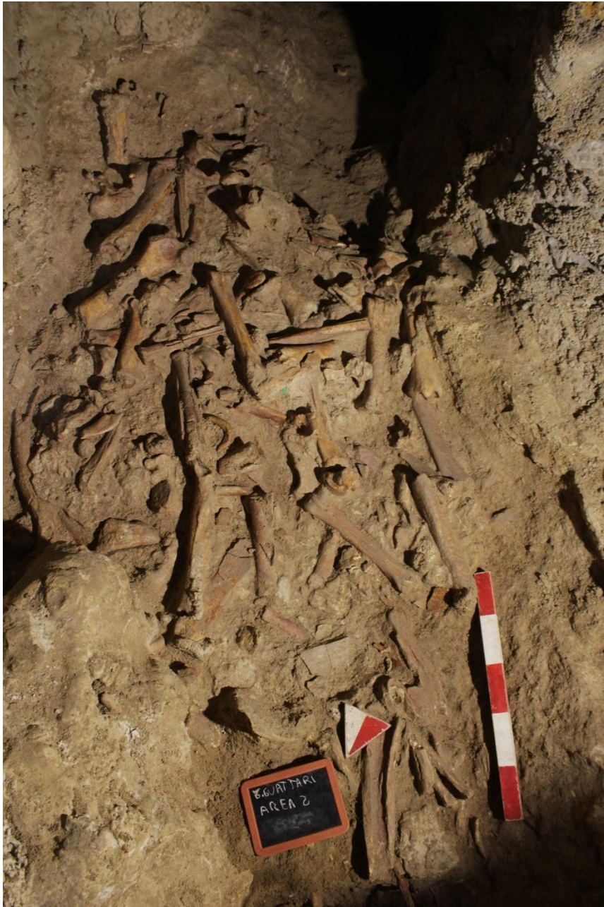
Figura 4- Grotta Guattari, sala del laghetto. Porzione di scavo della paleosuperficie a iena