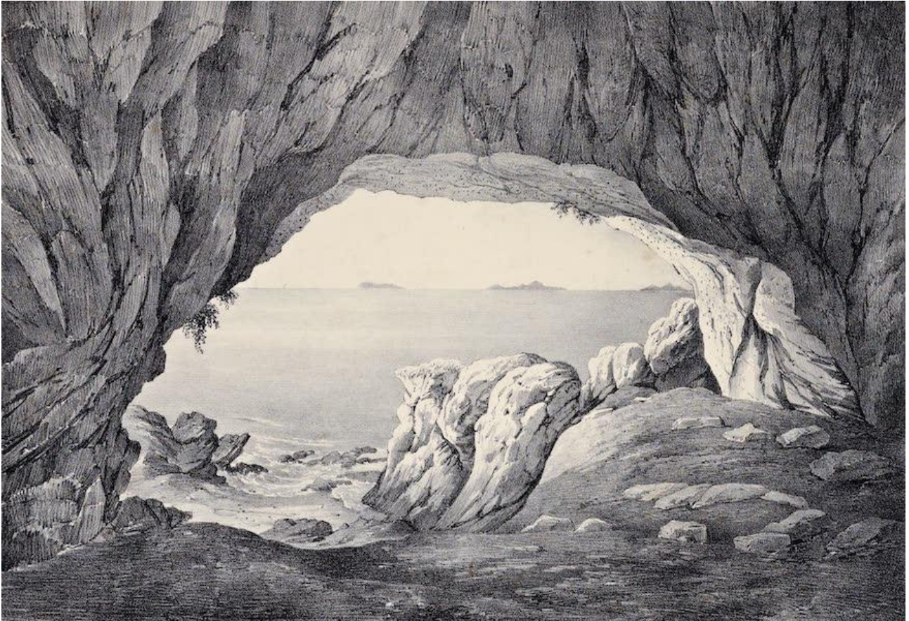
Figura 1- La prima rappresentazione grafica della Grotta delle Capre, 1834. (da E. Dodwell, 1834)